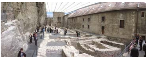
L'area archeologica dell'abbazia di Saint Maurice

Poi, di nuovo in montagna per due giorni fianco a fianco con i Guardaparco del Gran Paradiso . Un'esperienza resa ancora più eccezionale dall'aver assistito in diretta alle difficili catture di stambecchi per monitorare le condizioni di questa popolazione di ungulati.