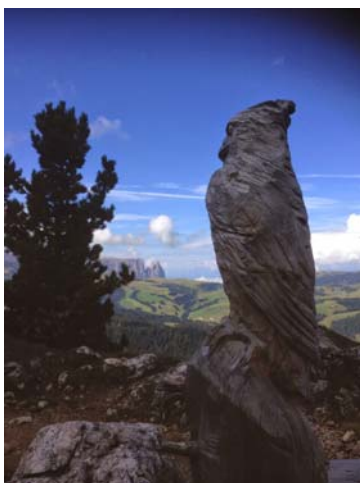
Lungo il giro del Sassolungo

Ecco un breve elenco degli ultimi viaggi realizzati tra settembre e i primi di ottobre. Viaggi brevi, in Italia o appena oltre confine, per servizi che sono apparsi o appariranno sui quotidiani con cui collaboro.