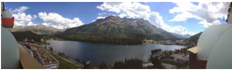
Panoramica dal balcone della stanza del Badrutt's Palace a Sankt Moritz

Di ritorno dalla Val Gardena, tappa a Sankt Moritz per visitare un hotel simbolo dell'hotellerie europea, il Badrutt's Palace . Onusto di gloria e un tantino appesantito per i gusti di una clientela moderna ma sempre sfarzoso, curato nei dettagli da 5 stelle lusso, preciso nel farvi entrare in un clima da favola, eccezionale nella qualità della Spa.